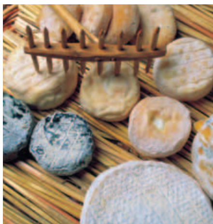
Oft bietet sich auch eine gute Gelegenheit, Wein, Käse oder andere Spezialitäten direkt beim Gastgeber einzukaufen. Ein Restaurantführer weist Ihnen zudem den Weg zu empfehlenswerten Restaurants.