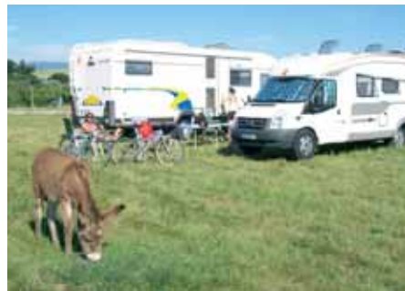
Mal ganz herrschaftlich, mal quasi auf der Weide – die Stellplatzangebote von France Passion sind sehr vielfältig.

Jahr für Jahr wächst die Zahl der Winzer und Bauern, die als Gastgeber Wohnmobiliten eine Übernachtung im Wohnmobil auf ihrem Grunde ermöglichen. In der 19. Auflage des «Carnet des Invitations» von France Passion sind bereits 1600 aktuelle Adressen aus allen Regionen Frankreichs aufgeführt. Davon sind allein 750 Winzer und 700 landwirtschaftliche Betriebe, womit insbesondere in Frankreichs ländlichen Gegenden viele Stellplätze vorhanden sind. Die France-Passion-Betriebe sind sehr vielfältig. Da gibt es Stellplätze beim Austernzüchter, in den Plantagen des Obstbauern, beim Imker, auf traditionsreichen Landgütern und ganz besonders bei Winzern, ob sie nun nur einen kleinen Rebberg bewirtschaften oder Besitzer eines herrschaftlichen Weingutes sind. Mittlerweile haben aber auch rund 50 französische Wohnmobiliten Übernachtungsplätze auf privatem Grund errichtet. Über 6500 Stellflächen sind über ganz Frankreich in 87 Départements verteilt.