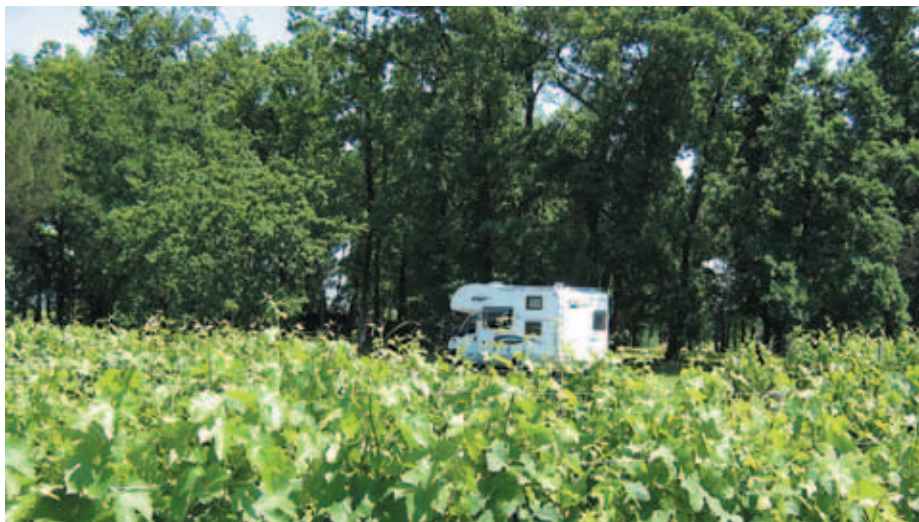
Bis zu 24 Stunden dürfen Sie mit dem Wohnmobil auf den gekennzeichneten Plätzen bei Frankreichs Winzern und Bauern stehen.

Französische Winzer, Bauern und Schlossbesitzer bieten Wohnmobilisten auf ihren Gütern Gelegenheit zu übernachten. Da kann man mitten in herrlicher Landschaft ganz offiziell eine Nacht in herrlicher Landschaft und Umgebung verbringen.