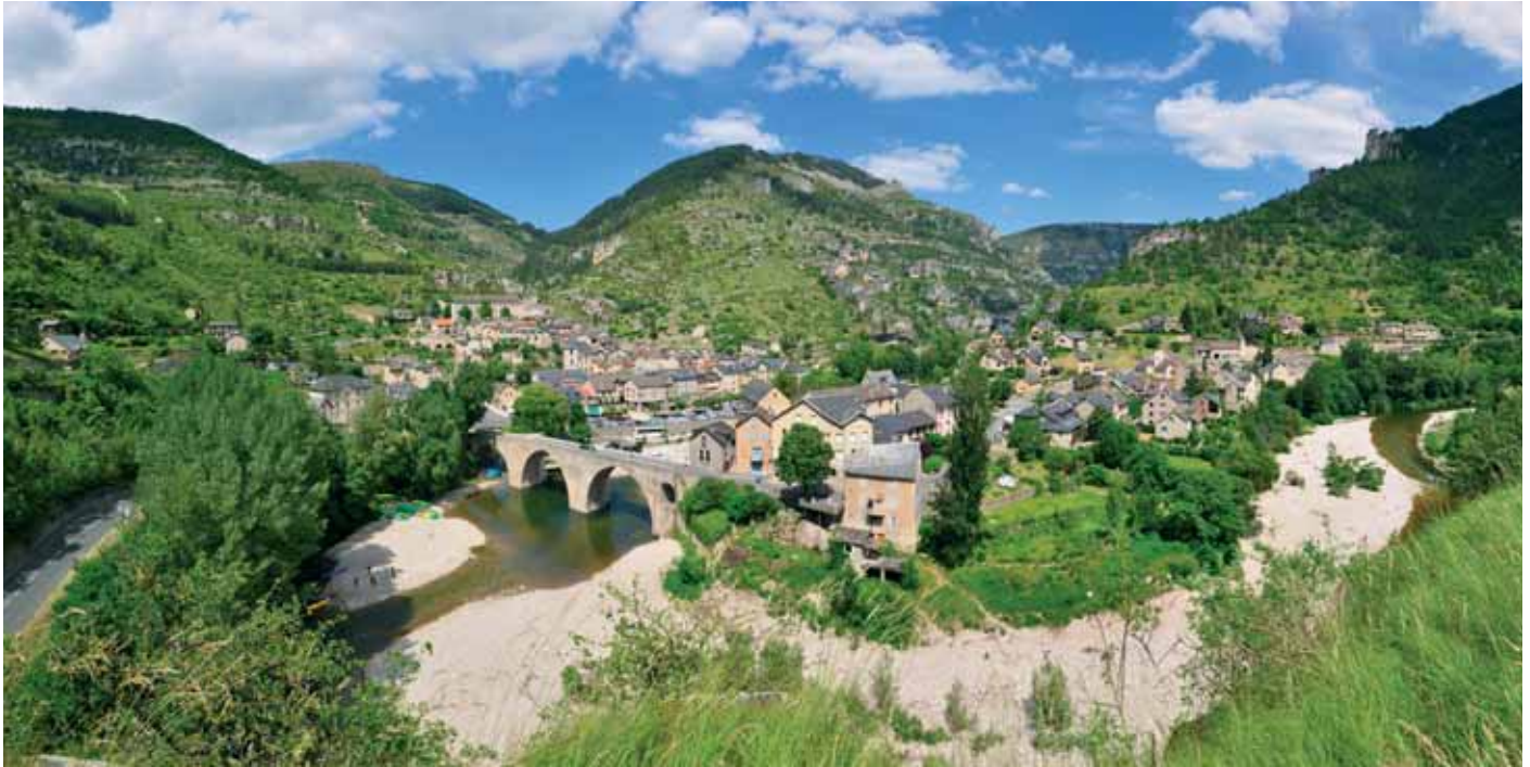
Wohnmobiliten bietet France Passion eine gute Gelegenheit, Frankreich ganz persönlich zu entdecken.